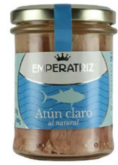
Atún al natural con "agua de mar" TM180ML