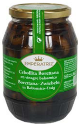
Cebollita italiana con vinagre balsámico TB965ML