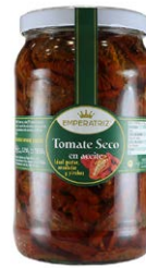
Tomate seco en aceite T1965ML (1/2 Galón)