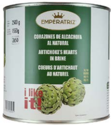
Corazones de alcachofa al natural 3KG 30-40 frutos