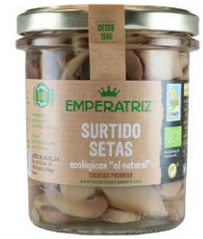
Champiñón laminado ecológico al natural TM355ML