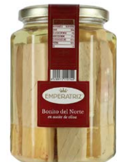
Bonito del Norte en aceite de oliva TM212ML