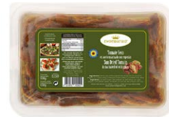
Tomate seco mitades en aceite BT1250ML