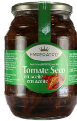
Tomate seco en aceite T965ML