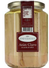
Atún claro en aceite de oliva TB250ML