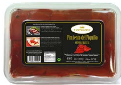
Pimiento del Piquillo entero al natural BT1250ML 30-45 frutos