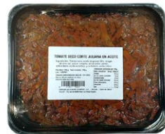
Tomate seco juliana en aceite BT2850ML