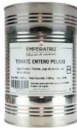
Tomate entero pelado al natural 5KG