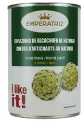
Corazones de alcachofa al natural TS314ML 8-12 frutos