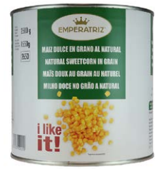
Maíz dulce en grano al natural 3KG